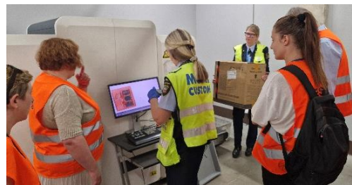
Фигура 1 Митнически проверки при взаимното посещение в Латвия

Финансирано от Европейския съюз. Изразените възгледи и мнения обаче са само на автора(ите) и не отразяват непременно тези на Европейския съюз или Европейския съвет за иновации и Изпълнителната агенция за МСП (EISMEA). Нито Европейският съюз, нито предоставящият орган могат да носят отговорност за тях.