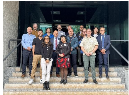
Figura 2: Gruppo di Lavoro durante la visita in Italia