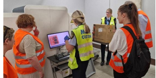
Figura 1: Esame doganale durante la visita in Lettonia

Il gruppo di lavoro ha anche visitato un laboratorio di prova, acquisendo in questo modo una visione chiara delle sfide e delle prospettive sia dei laboratori che dei produttori.